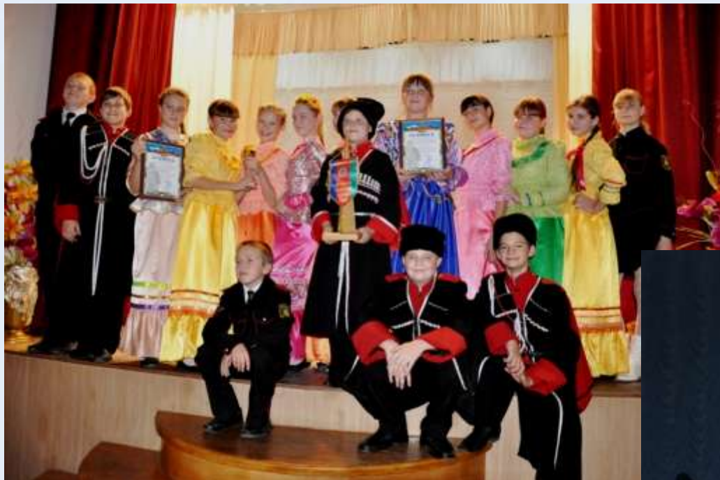
Фестиваль казачьих классов